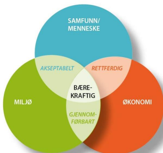
Sammenhengen mellom de tre likeverdige bærekraftselementene.

ARIKS skal arbeide etter modellen, der det er likeverd mellom hensynet til samfunn/menneske, miljø og ressursutnyttelse og en sunn økonomi.