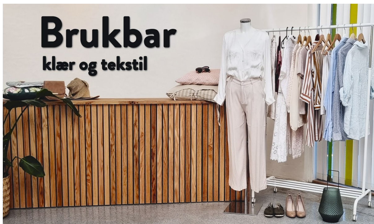
Brukbar – klær og tekstil butikken på Heftingsdalen.